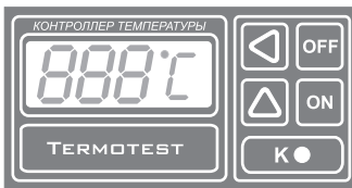
Рис.1 Передняя панель прибора.

Система автоматически определяет подключен датчик к прибору или нет, а также обрыв в датчике или соединительных проводах. В этом случае на индикаторе появляются три черточки по середине (- - -) и блокируется работа коммутирующего элемента (реле). Аналогичная ситуация возникает если температура датчика опускается ниже 0 °С или повышается выше 400 °С.