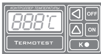
Рис.1 Передняя панель прибора.

Система автоматически определяет подключен датчик к прибору или нет, а также обрыв или короткое замыкание в датчике или соединительных проводах. В этом случае на индикаторе появляются три черточки по середине (- - -) и блокируется работа коммутирующего элемента (реле). Аналогичная ситуация возникает если температура датчика опускается ниже минус 60 °С или повышается выше 250 °С.